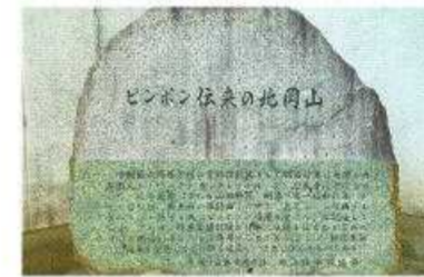
日本ピンポン伝来の地から 近い将来、五輪メダリストを

新規ビジネスの相談に長年携わる専門家は「豊かな地域なので、群れなくても生きていける、ある程度の失敗をしても何とか生きていける。そんな感覚があって、ひとと違うことが抵抗なくできたり、新しいことに挑戦できたりというのが、岡山スピリットを構成しているのかも」と分析する。