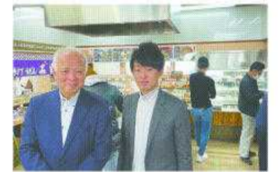
1杯100円に勝機を賭け 苦肉の策だった「セルフ方式」

セルフうどん発祥の店として知られる「手打ちうどん名玄」(岡山市中区平井)。創業当時、うどん屋としては後発で、「1杯100円」のインパクトに勝機を賭けた。限られた資金と人でこなすには、お客の手を借りるしかない。苦肉の策で生まれたのが「セルフ方式」。子ども連れを中心に面白い人が多く、客数は日ごとに増えた。てんぷらやごはんものをセットにしたのも同店が初。今年年間30万人近くが訪れる。45年がたった今も、良質の水や国産小麦100%の麺など、味と安心の追求に余念がない。